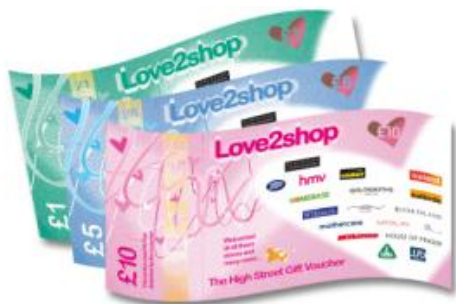
Love2shop Talebau siopau'r stryd fawr